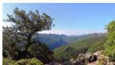
A. Ledda | Ormuvrone Sa Portisra Urzulei