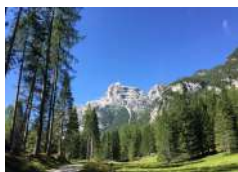
G. Basso Nani e giganti