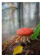
D. De Rubeis La casa dei Puffi