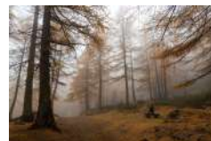
C. Rolando Immerso nel bosco