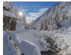
S. Fantini Neve fresca