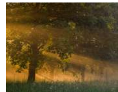
S. Fantini | Prime luci al Parco delle Risorgive