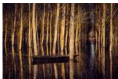
A. Amato | Zone umide