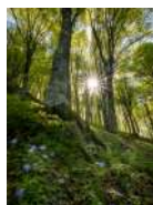
S. Spina Bosco Incantato