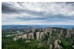
A. Vissani | Colline nere