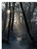
I. Pampanin Sentieri di neve