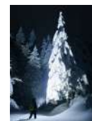
N. Dani White Dream