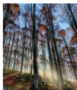
E. Bertaggia Spiragli d'alba