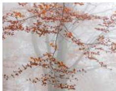
S. Fantini | Autunno nella faggeta