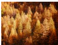
E. Forcina | Larici illuminati d'autunno