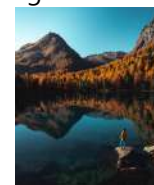
G. Guidetti Perfezione naturale